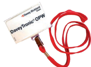
Carte de sécurité RFID pour mise à feu