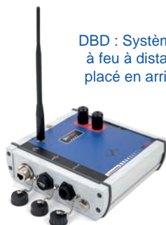
DBD : Système de mise à feu à distance radio placé en arrière du tir