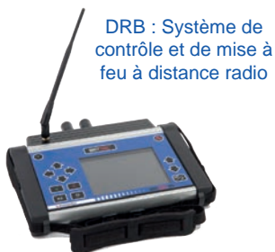
DRB : Système de contrôle et de mise à feu à distance radio

L'ensemble OPW Daveytronic est constitué de 3 éléments principaux, d'une carte sécurisée RFID autorisant la procédure de mise à feu et des accessoires de recharge des batteries.