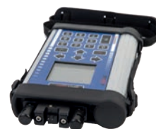
PU : Système de programmation des temps