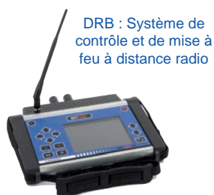
DRB : Système de contrôle et de mise à feu à distance radio

L'ensemble OPW Daveytronic est constitué de 3 éléments principaux, d'une carte sécurisée RFID autorisant la procédure de mise à feu et des accessoires de recharge des batteries.