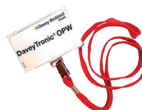
Carte de sécurité RFID pour mise à feu